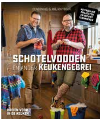
Schotelvoddens en ander Keukengebrey met Mr. Knitbear ISBN 978 90 245 9483 2