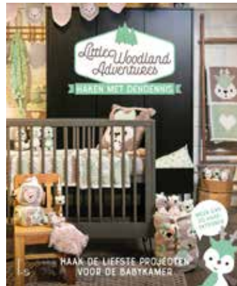
Little Woodland Adventures haken met Dendennis ISBN 978 90 245 9478 8