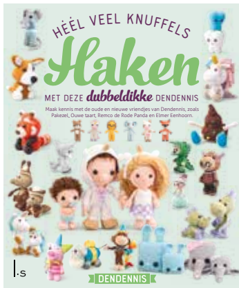
Heel veel knuffels haken met deze dubbeldikke Dendennis ISBN 978 90 245 8248 8