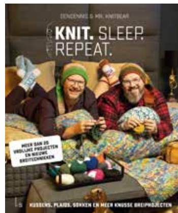
Knit. Sleep. Repeat. met Mr. Knitbear ISBN 978 90 210 3353 2

Het patroon van deze leuke Dikkie Dik-handpop kun je vinden op www.dendennis.nl/dikkiedik