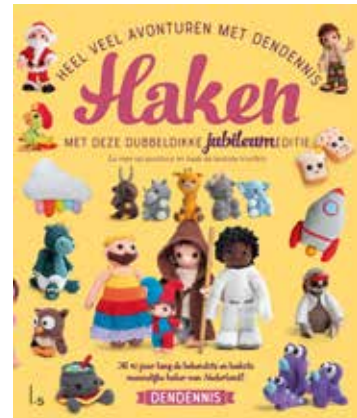
Heel veel avonturen met Dendennis haken met deze Dubbeldikke jubileumeditie ISBN 978 90 245 9484 9