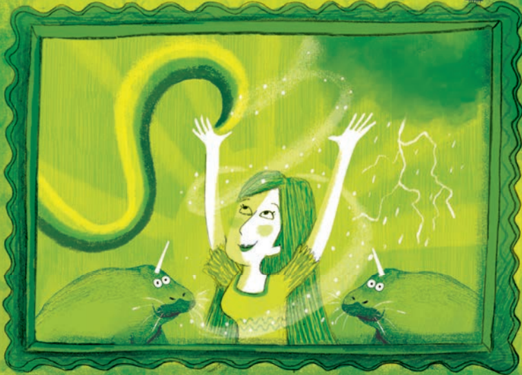
Tiffy: weerheks & zeekoehoornambassadeur