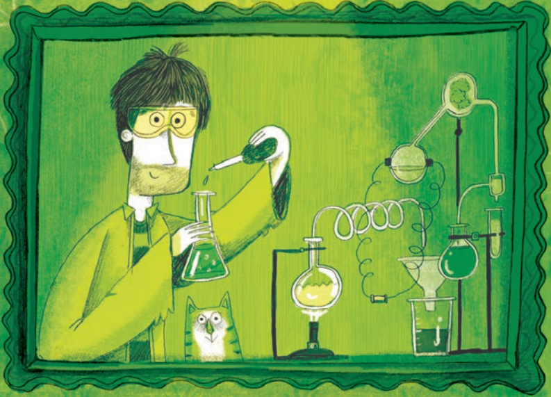
Dr. Yeti: alchemist & brandstofcelfanaat

Dit boek is opgedragen aan deze buitengewone ontdekkingsreizigers: